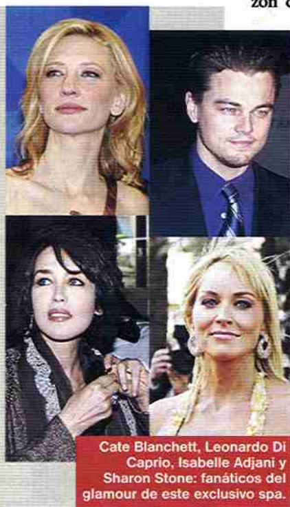
Cate Blanchett, Leonardo Di Caprio, Isabelle Adjani y Sharon Stone: fanáticos del glamour de este exclusivo spa.

Monte Carlo, cuyo nombre rinde tributo al Príncipe Carlos III, fue creada en 1863. Por aquellos días, La Société des Bains des Mer impulsó la creación del famoso Casino de la ciudad y del mítico Hotel de Paris. La Société fue también la responsable de dar vida a: Les Thermes Marins , Monte Carlo Country Club , L'Hotel Hermitage , L'Hotel Mirabeu , y Le Sporting d'Été . Con más de 300 días de sol por año y temperaturas suaves, esta refinada ciudad le da la bienvenida a las celebridades más exigentes del mundo. Rod Stewart, Sting, Pavarotti, Isabelle Adjani, Sharon Stone, Alain Delon, Brad Pitt y Angelina Jolie, Cate Blanchett, Leonardo Di Caprio, Robert Redford, Andre Agassi, Steffi Graff, David Beckham y Victoria Adams son frecuentes visitantes de Les Thermes Marins de Monte Carlo .