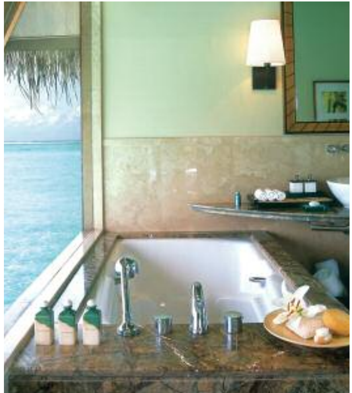
Taj Exotica Resort & Spa PO Box 2117 | South Male Atoll | Maldives Tel: 00 960 664 22 00