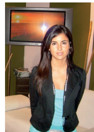
Solanas Convention Center